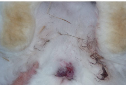
Mère et fille ont vécu 14 mois ensemble en toute quiétude jusqu'au printemps où les hormones ont rendu la mère folle au point qu'elle a attaqué sa fille et l'a mordue dans les parties génitales. Les conséquences étaient des blessures par morsure et des épanchements de sang diffus.

Les lapins étrangers sont attaqués par tous les membres du groupe, le plus violemment par les mâles les plus haut gradés. Si l'intrus ne fuit pas, il subit de graves blessures et est même tué. De façon ciblée ce sont les parties génitales qui sont mordues jusqu'à castration. Les lapins se reconnaissent à l'odeur du groupe, le lapin mâle dominant marque ses congénères avec les sécrétions des glandes du menton, parfois aussi avec les urines. Celui qui n'a pas l'odeur du groupe est attaqué. Ces agressions peuvent avoir lieu contre ses propres jeunes sujets, si ces derniers ont été aspergés d'urines de lapins étrangers !