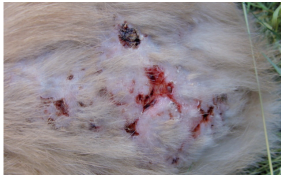
D'importantes blessures par morsure ou grattage sur le dos d'une lapine d'un an d'une détention en groupes. Elle vivait ensemble avec son frère et une autre lapine qui lui était supérieure.

La vie de lapin de garenne suit un rythme saisonnier bien défini. En hiver, lors de la pause de reproduction, il ne fait que de manger et de dormir. Les lapins et les femelles se tolèrent et ne font pas de cas l'un de l'autre. La hiérarchie stricte s'est assouplie. A la sortie de l'hiver prend fin la période d'atmosphère sympathique ; sous l'influence d'hormones les animaux deviennent brusquement agressifs contre les membres du groupe du même sexe.