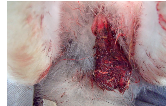
Des lapins qui ne sont pas castrés se bagarrent violemment et subissent de graves blessures. Ici un lapin avait franchi la séparation et se querella avec son voisin à qui il arracha un testicule.

Un système immunitaire stable peut maintenir un équilibre des parasites. Le stress affaiblit le système immunitaire, les coccidies prennent le dessus et l'animal tombe malade. On peut mettre en évidence un taux plus élevé d'hormones de stress chez les bêtes moins gradées et leur cœur bat plus rapidement. Le stress se manifeste également sur le com-